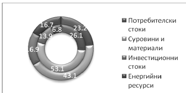
Фиг. 2. Структура на износа по видове стоки според начина на използване (%) за 1995 г. (вътрешен сегмент) и 2012 г. (външен сегмент)