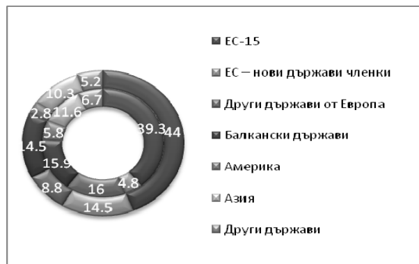
Фиг. 4. Географска структура на износа по търговски региони (%) за 1995 г. (вътрешен сегмент) и 2012 г. (външен сегмент)

първ път от 2000 г. насам страните от ЕС формират под ½ от българския внос , докато техният дял в износа ни е относително стабилен – около 60 процента. Втори по значение пазар остават балканските страни с 15% от износа , следвани от азиатските страни с 10 процента. Слаб ръст отбелязват страните от Източна Европа – от 8 % на 9 процента. В същото време техният дял в българския внос нараства от 21 % на 24 процента. Делът на страните от Азия достига 14%, а на балканските страни и държавите от Америка – по 7% (табл. 4 и 5, фиг. 4 и 5).