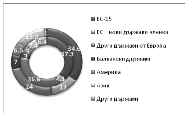
Фиг. 5. Географска структура на вноса по търговски региони (%) за 1995 г. (вътрешен сегмент) и 2012 г. (външен сегмент)