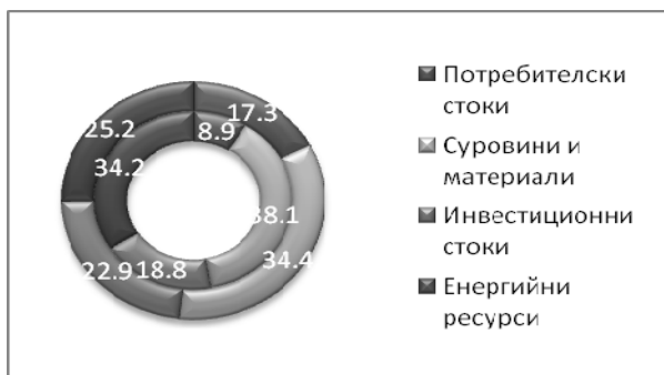
Фиг. 3. Структура на вноса по видове стоки според начина на използване (%) за 1995 г. (вътрешен сегмент) и 2012 г. (външен сегмент)

В географската структура на външната ни търговия се проявяват някои интересни нови тенденции. За